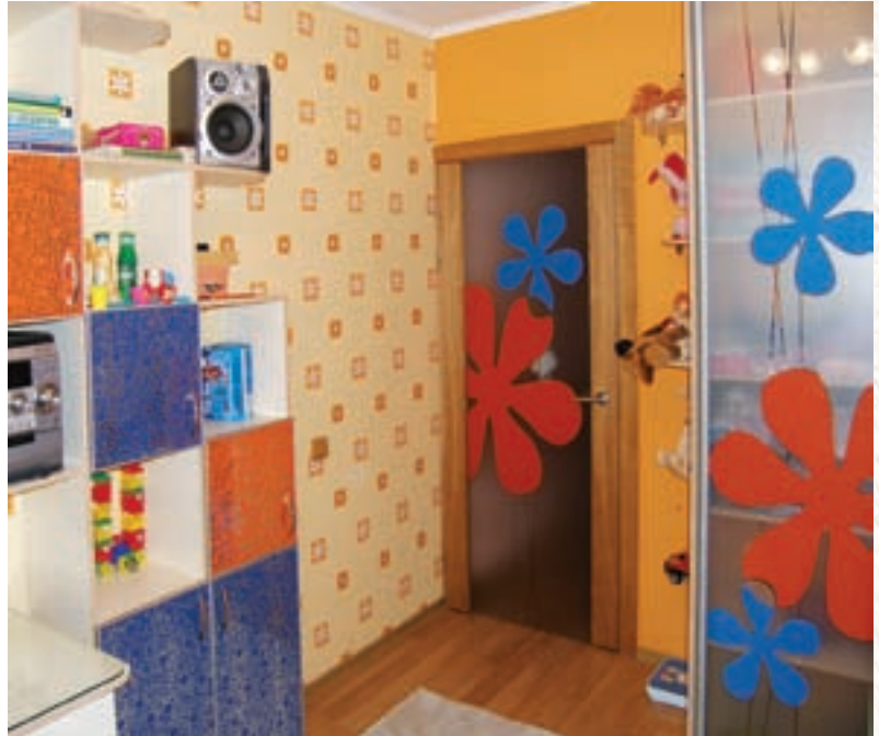
Работа выполнена партнёром компании 3M

Портфель декоративных материалов компании 3M содержит все необходимые решения для полного оформления интерьера, представляя собой комплексное предложение для дизайнеров, специали-