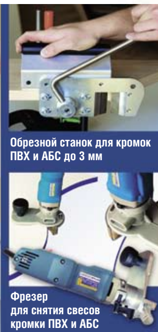
Обрезной станок для кромок ПВХ и АБС до 3 мм