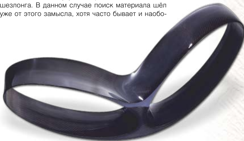
Мебельщик №3 (17), 2007

Знакомство Рона Арада с «сотами» произошло во время работы над этим шезлонгом