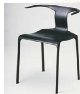
Мебельщик №3 (37), 2007